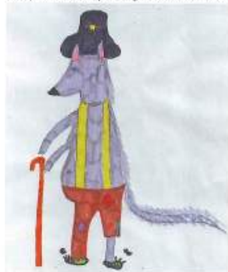
Le loup-berger (pas bien méchant !)

Des petits, des gros, en bois, plastiques, polystyrène, carrelages ou encore bouchons, ficelles et boîtes, tous ces moutons avaient posé leur habit de laine pour en revêtir un bien plus original. Bien gardés par deux loups bergers bienveillants,