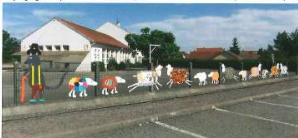
Une partie du troupeau

Ces spectacles seront ouverts au public. Nous comptons sur un public nombreux pour venir admirer et applaudir les artistes en herbe.