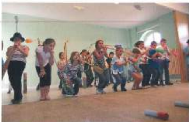
Les artistes en répétition à la salle des fêtes