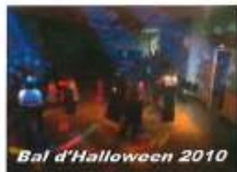
Bal d'Halloween 2010

Par courrier dans la boîte à lettres FCPE de l'école d'Hauterive Par téléphone : Jérôme Busserolles (Président) 06 89 42 89 48