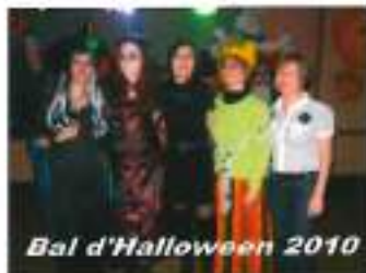
Bal d'Halloween 2010