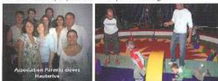
Association Parents élèves Hauterive

L'association participe au financement de l'activité musicale, aux abonnements de revues scolaires, aux sorties scolaires, accompagne les actions entre 12 h et 14 h et finance les dictionnaires aux élèves de CM2 qui quittent l'école pour le collège.