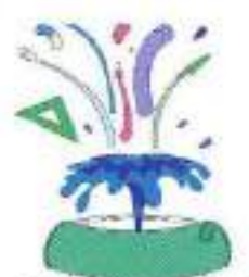
ECOLE DES SOURCES 03270 HAUTERIVE